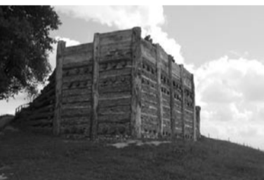
Geschichte auf dem Vully