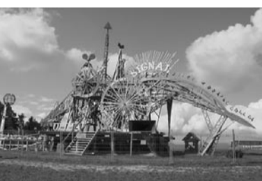
Holzwerkwerk von Luginbühl

Der Gewerbeverein Düdingen ging am 11. September 2002 auf die Reise und erlebte, dass man um Neues zu entdecken, keine mehrstündige Reise machen muss.