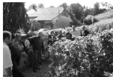
Weingut Simonet Môtier