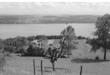
Eine besonderer Aussicht