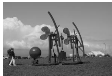
Stahlwerkwerk von Luginbühl