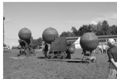
Stahlwerkwerk von Luginbühl