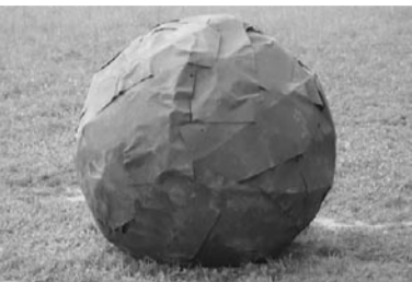
Kunstwerke von Noah Bischof