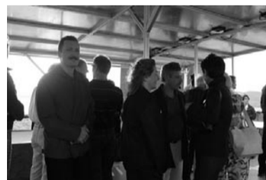
Auf dem Weg zum Monolithen