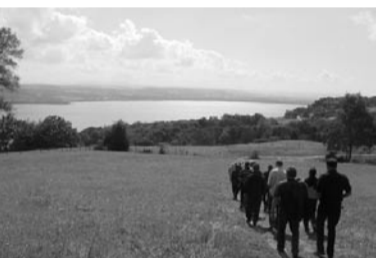
Spaziergang mit Blick auf See