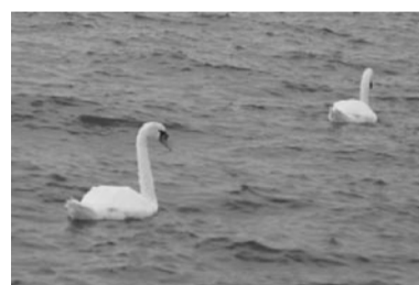
Nicht alle hatten trockene Füsse